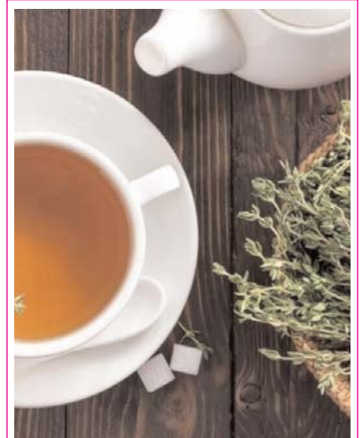
Kəklükotu çayı infeksiya mövsümündə faydalıdır

qaraciyərin ətrafı piy qatı ilə örtülür, onun funksiyalarını tam yerinə yetirməsinə, digər orqanlarla əlaqələrin pozulma-