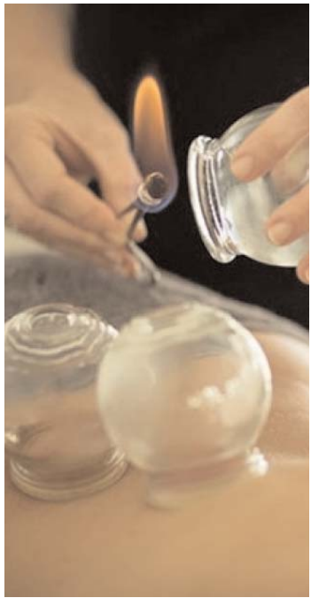
Tibbi bankalardan dəstəkləyici vasitə kimi istifadə etmək olar

Köhnə müalicə üsulu olan bankalanmaq kiçik bankalarla dərinin təbəqələri arasında yığılan və qaraciyərdə toplanan toksinləri vakuumlayaaraq alma üsuldur. Qaraciyər bədənində detoks orqanı kimi toksinlərlə mübarizə aparır, onları yox edir. Banka vasitəsilə həmin toksinlər vakuumlanaaraq sorulur.